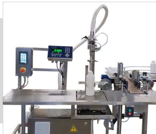
Llenadora por peso y mesa de acumulación