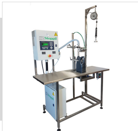
Llenadora por peso