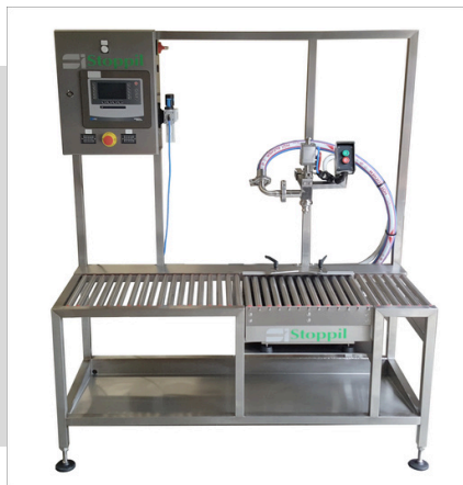
Mesa por peso con rodillos